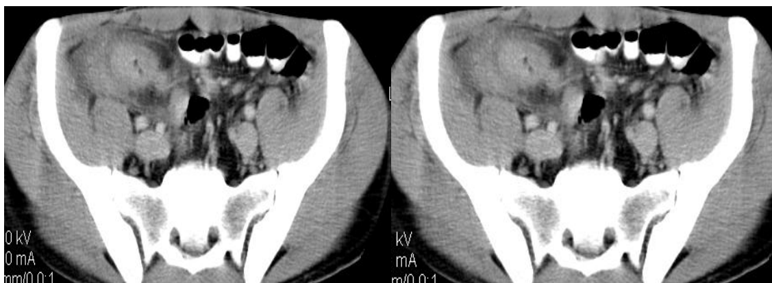
Fig. 1. Tomografie computerizată Tumoră ileocecală cu fistulă ileo-rectală

Examele de laborator arată un sindrom inflamator nespecific (proteina C reactivă = 48 U/mL, fibrinogen = 518 mg/dL, leucocite = 10500 /mmc), o anemie microcitară de 10,8 g/dL cu o hiposideremie de 13 μg/dL, o trombocitoză de 581000/mmc și ușoară colestază. Markerul tumoral ACE (Antigen Carcino-Embrionar) a fost negativ precum și intra-dermo-reacția la PPD. Ac pANCA (efectuați datorită sindromului colestatic intrahepatic) au avut valori normale sugerând o colestază inflamatorie. Trombocitoza a fost interpretată în același sens.