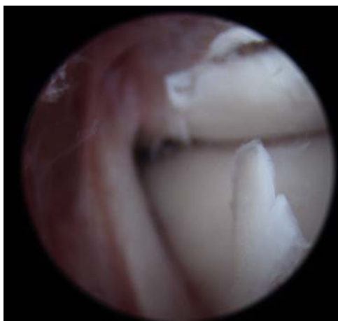
Fig. 3 Evidențierea laxității de LTFA