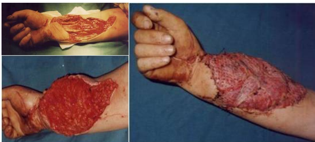
Fig. 2 Defect de părți moi după mușcătură de cal: înainte și după transferul liber de mare epiplon

Un pacient din cei 14 cu defecte de părți moi la membrul pelvin avea vârsta de 17 ani, restul prezentau vârste cuprinse în intervalul 29-50 ani; 13 pacienți au victime ale unor accidente (rutiere – 9, de muncă – 2, casnice – 2), iar tânărul de 17 ani a fost internat cu diagnosticul de artrită dublă (glezna dreaptă și genunchiul stâng) de origine iatrogenă (posibil artrită tip RAA tratată prin punționarea articulațiilor afectate și injecție de antibiotic, suprainfectată cu germeni de spital, multiplu rezistenți la antibioterapie).