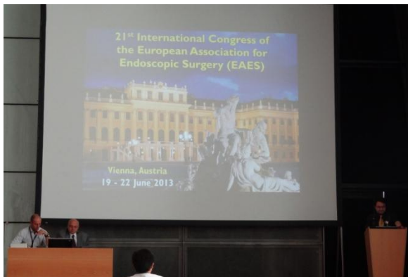
Fig. 3 Sesiunea Clinical advances in robotic surgery

Congresul s-a încheiat cu prezentarea și premierea celor mai bune lucrări și postere, 15 dintre participanții sub 35 de ani fiind răsplătiți, prin tragere la sorți, cu un I-Pad.