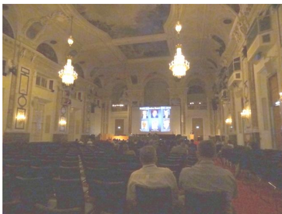
Fig. 4 Adunarea generală EAES

prezentate prin intermediul unei moderne interfețe wireless adresată laptopurilor, tabletelor și telefoanelor de tip smartphone. Trebuie de asemenea menționată sesiunea How I do it dedicată chirurgiei bariatrice, moderată de C. Copăescu (România) și G. Prager (Austria) în care au fost discutate tehnicile actuale de sleeve gastrectomy - C. Balague (Spania), gastric bypass - A. Maleckas (Lituania), endoscopic sleeve - N. Bouvy (Olanda), gastric plication - R. Mittermair (Austria)). Un loc aparte în programul celei de a doua zile l-a avut reuniunea de consens dedicată bolii de reflux gastro-esofagian (președinte K. Fuchs (Germania); moderatori B. Babic (Germania), W. Breithaupt (Germania), F. Granderath (Germania), A. Fingerhut (Franța), E. Furnée (Olanda), P. Horváth (Ungaria), P. Kardos (Germania), R. Pointner (Austria), E. Savarino (Italia), M. Van Herwaarden (Olanda), G. Zaninotto (Italia)); discuțiile au fost axate pe indicațiile actuale ale intervențiilor laparoscopice fiind de reținut atât indicațiile clasice (boală de reflux rezistentă la tratament, leziuni obiectivate endoscopice, pH-metrie și/sau manometrie esofagiană) cât și indicațiile „relative” (reflux clinic manifest dar neobiectivat endoscopic sau/și prin pH-metrie); în acest sens a fost discutată importanța semnelor minore de reflux: pneumopatii repetitive, tuse nocturnă / posturală, fibroza pulmonară etc. Concluziile reuniunii de consens vor fi publicate în Surgical Endoscopy .